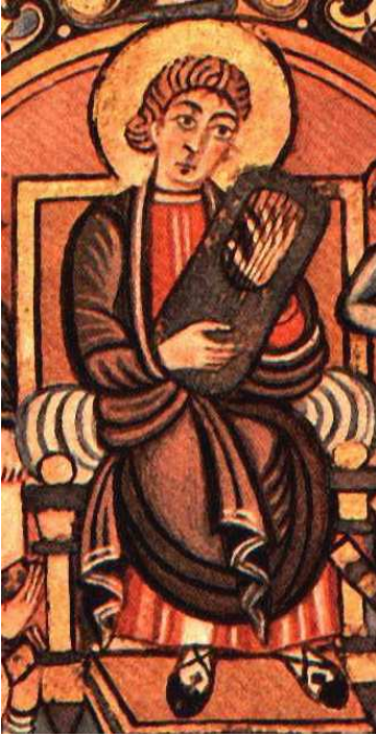
Re Davide suona la Lyra (Salterio Vespasiano, sec. VIII)

Aurea personet Lyra: chiara risuona la voce della lyra , regina fra gli strumenti musicali medioevali, spesso rappresentata nei manoscritti in mano al Re Davide in persona. La lyra è però uno strumento dalle caratteristiche sfuggenti, raffigurato in molte miniature ma forse poco utilizzato nella pratica, quasi esprimesse più un simbolo ideale, che un oggetto reale.