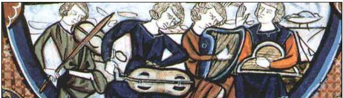
Musici e strumenti musicali (manoscritto francese del secolo XIII)

I testi originali delle canzoni, tradotti e raccontati al pubblico, completano il mosaico: dalla crociata al pellegrinaggio, dalla passione d'amore alla devozione cristiana il messaggio che gli uomini del tempo volevano esprimere giunge chiaro fino ai giorni nostri, dimostrando ancora oggi la sua piena attualità.